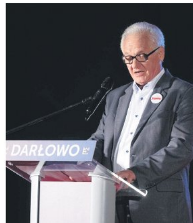
Zbigniew Bujak, legenda podziemnej Solidarności