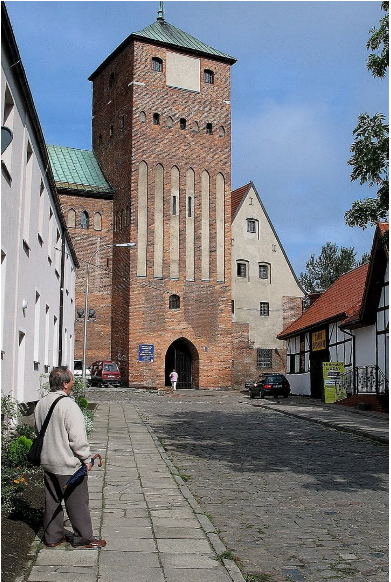
Od środy 13 maja 2020 Muzeum Zamku Książąt Pomorskich w Darłowie