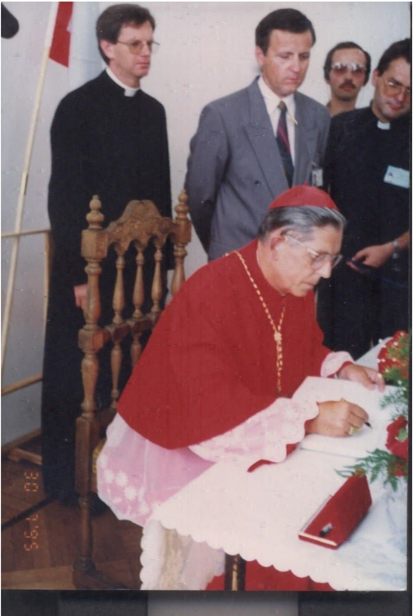
Tegoroczny Dzień Samorządu Terytorialnego odbywa się w 30. rocznicę