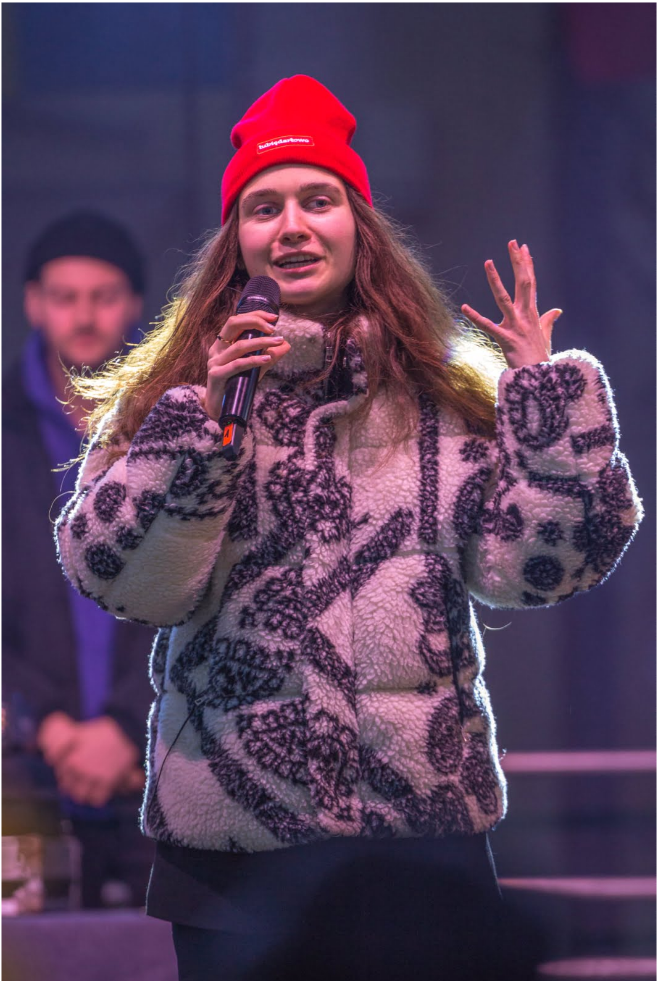
10 kwietnia, w niedzielę, miał miejsce finał charytatywnej akcji pn. Morze