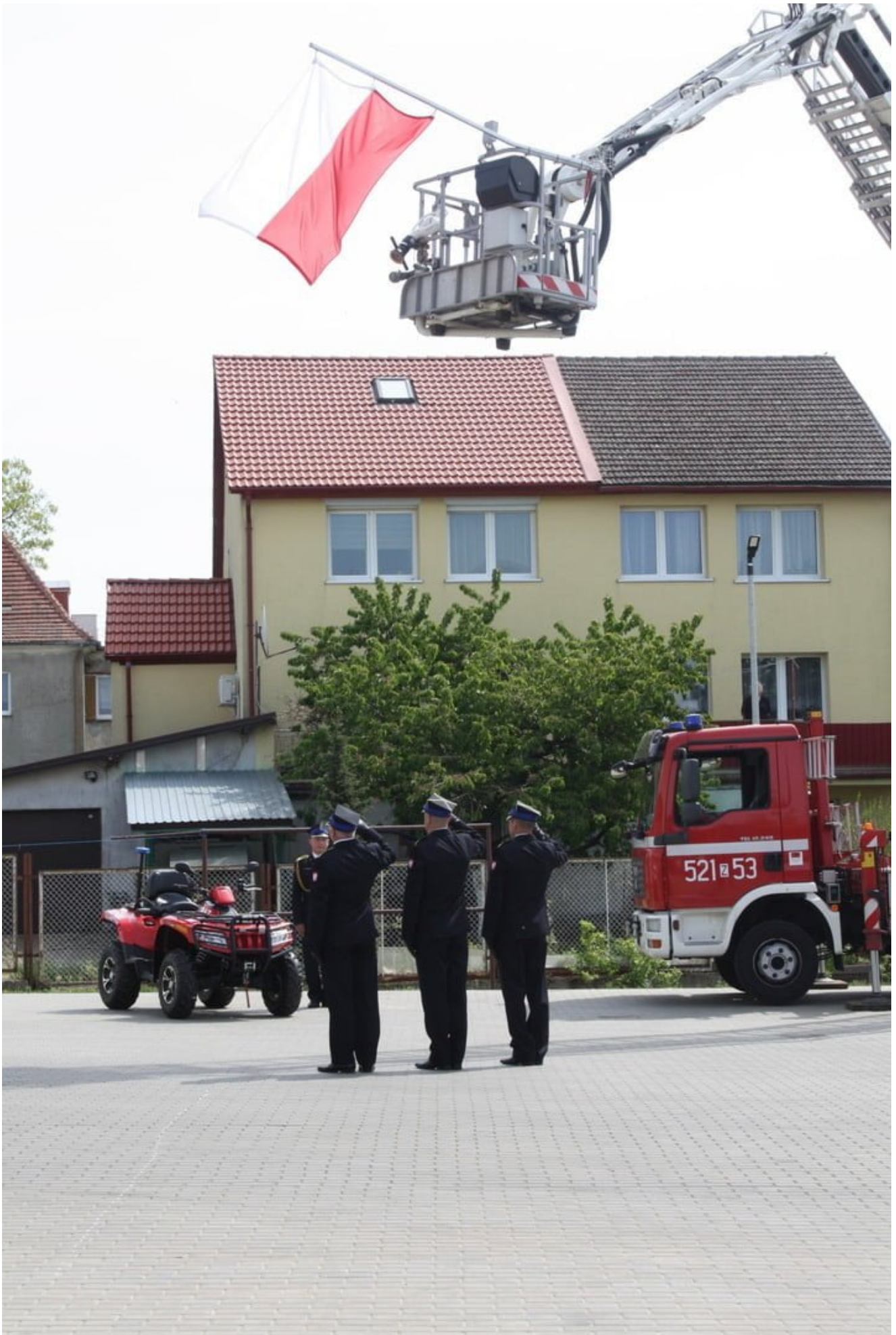
19 maja 2022 roku na placu wewnętrznym Komendy Powiatowej Państwowej