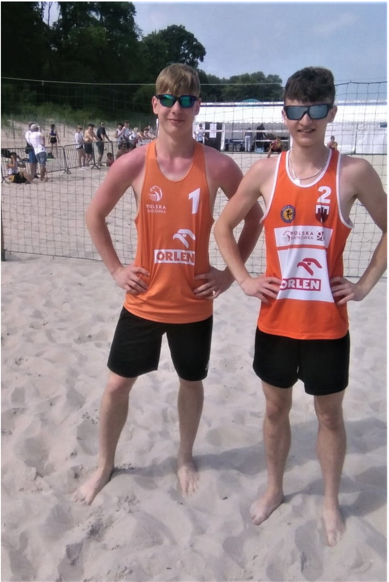
Siatkówka plażowa, dyscyplina olimpijska, wzbudza coraz większe zainteresowanie